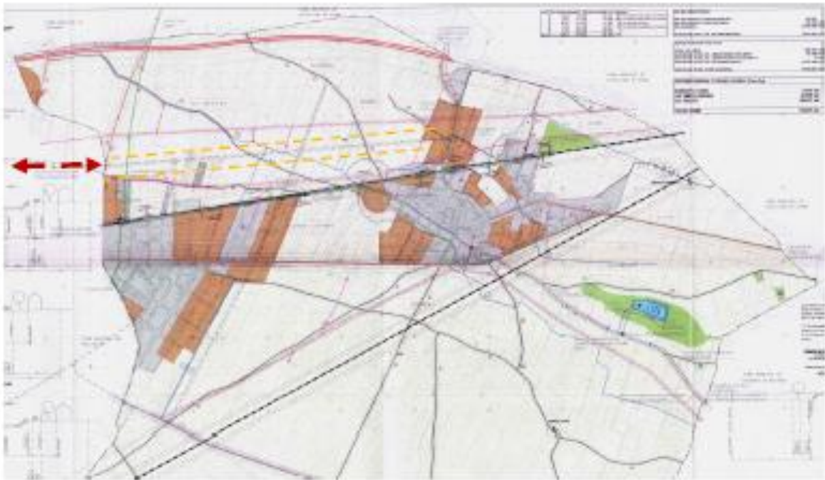
POUM de Golmés (AD 13 setembre 2006). Plànol O-01 "D'ordenació i règim jurídic del sòl"

Vial Nord, si no que resolts la connexió amb l'eix de l'antiga CN-II, reservant terrenys per la connexió del Vial Nord amb la CN-II amb la traça d'un vial entre la rotonda existent situada sobre aquesta última al polígon de Golpark a l'alçada del centre comercial Eroski fins a la prolongació del Vial Nord al terme de Golmés. No concreta però, quin tipus d'infraestructura seria necessari construir per resoldre el pas de la via del ferrocarril de Lleida a Barcelona per Manresa.