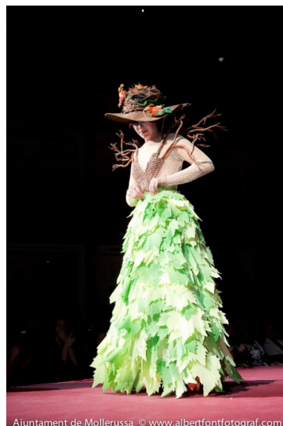
Ajuntament de Mollerussa

Com a complements, porta un barret i en el casc s'ha confeccionat un niu amb ocells; aquests són l'anagrama del concurs.