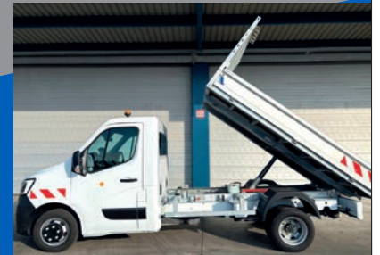
RENAULT MASTER any 2022 82.181 km / 29.500 € + iva

Autovia A-2 Lleida - Barcelona km 486 - Sortida 487 / comercial@noudiesel.cat