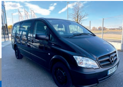
MERCEDES VITO any 2011 252.345 km / 12.800 € + iva