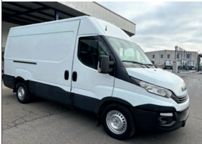
IVECO DAILY any 2018 200.224 km / 15.680 € + iva