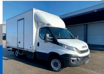
IVECO DAILY any 2017 240.000 km / 20.000 € + iva